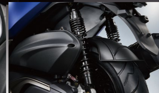
後避震器5段式可調雙後避震器