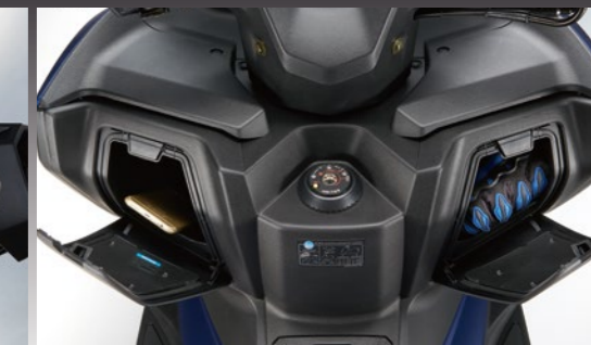
雙手套箱設計、USB 5V充電座