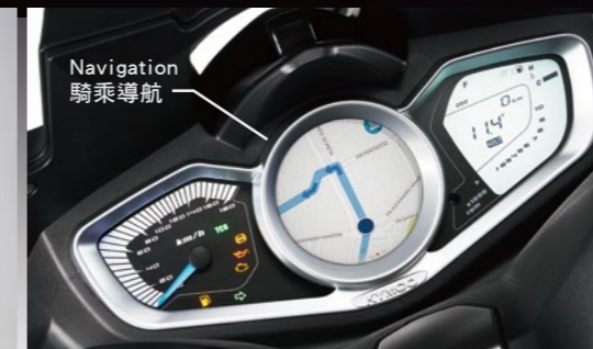
Noodoe車聯網 使個人移動更為智慧 提供「時間、時速表、天氣、智慧羅盤、通知、導航及尋車」功能