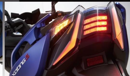
高亮度LED導光條狀尾燈 提升行車時的辨識度