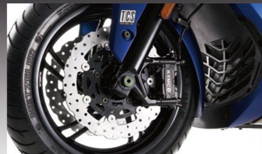
高效能前雙碟280mm ABS剎車系統

人體工學二段式坐墊 採用二段式坐墊的聰明設計，騎士只需開啟坐墊前段就可以輕鬆拿取置物箱內的物品。