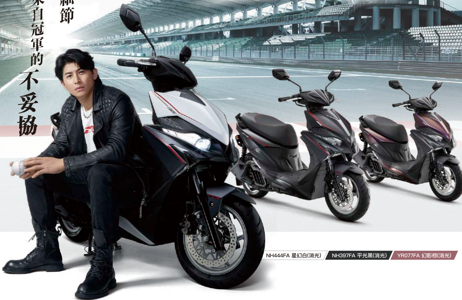
NH444FA 星幻白(消光) NH397FA 平光黑(消光) YR077FA 幻影棕(消光)