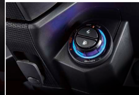
KEYLESS感應式鑰匙 免鑰匙啟動晶片龍頭鎖 (上鎖/開油箱蓋/座墊開關)