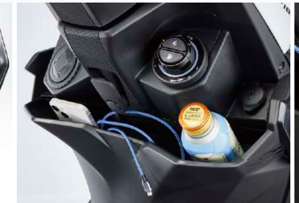
寬口式加深前置物箱 大杯飲料、手機，顛簸路面也安心