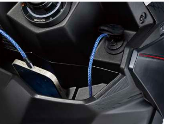
快充USB-C PD支援 Apple / Android