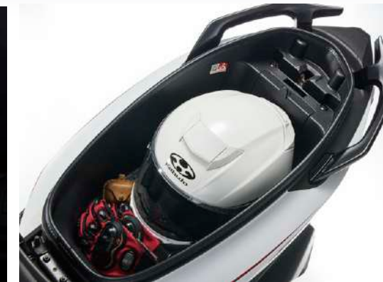
28.4L置物箱 大容量平整化車廂，輕鬆放入全罩安全帽