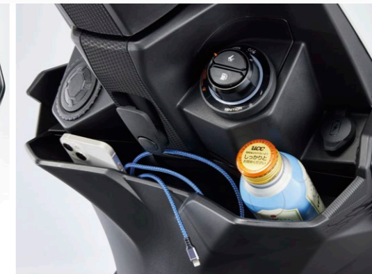
寬口式加深前置物箱