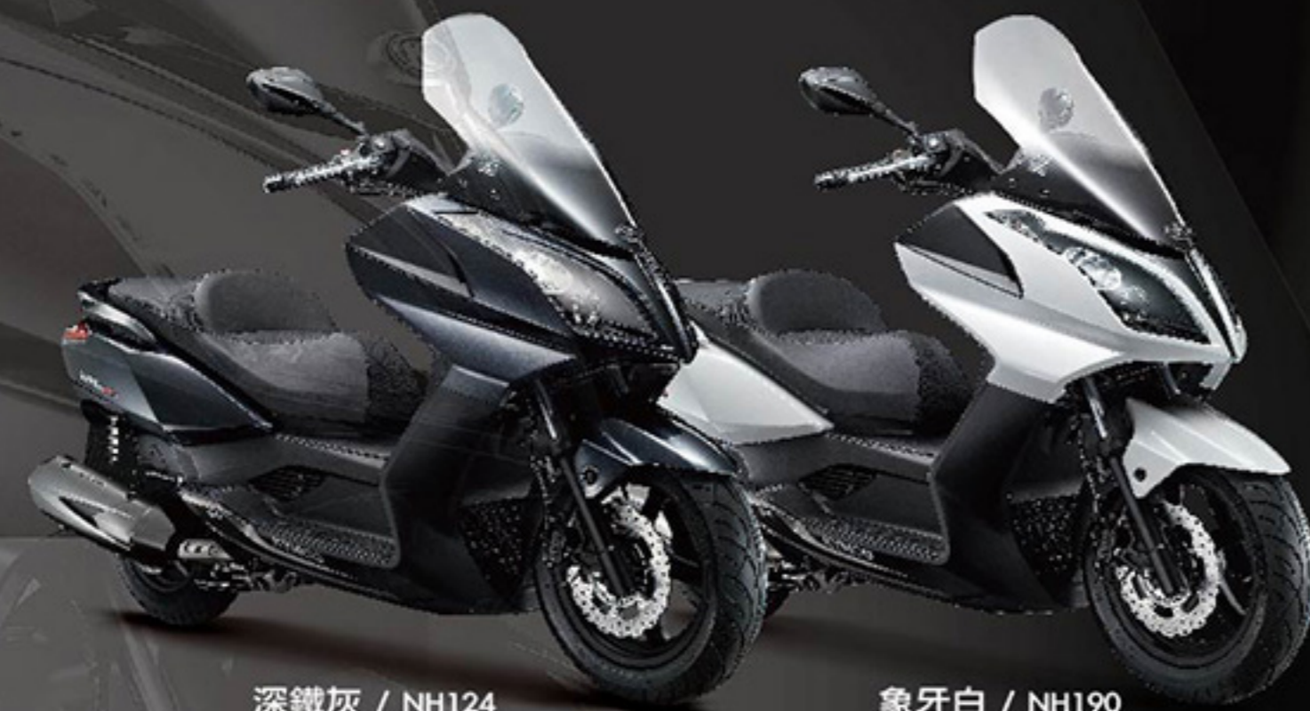
深鐵灰 / NH124