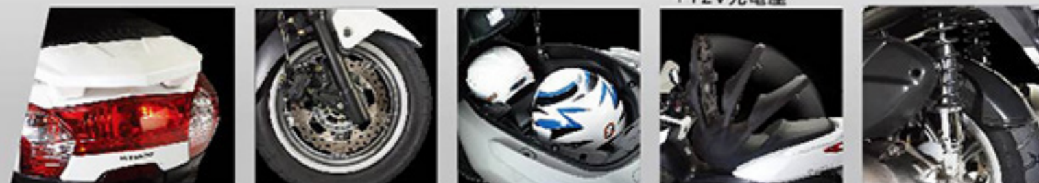
■ 包覆式大型後剎車燈 ■ 260mm大型浮動式浪花碟剎 ■ 超大容量置物箱 ■ 氣壓輔助開啓座墊 ■ 可調式雙後避震器