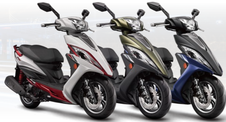
G6 150 雙碟版 平光白 NH265FA / 平光墨綠 WG531FA / 平光黑 WN105FA