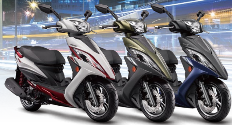
G6 150 ABS特仕版 平光白 NH265FA / 平光墨綠 WG531FA / 平光黑 WN105FA