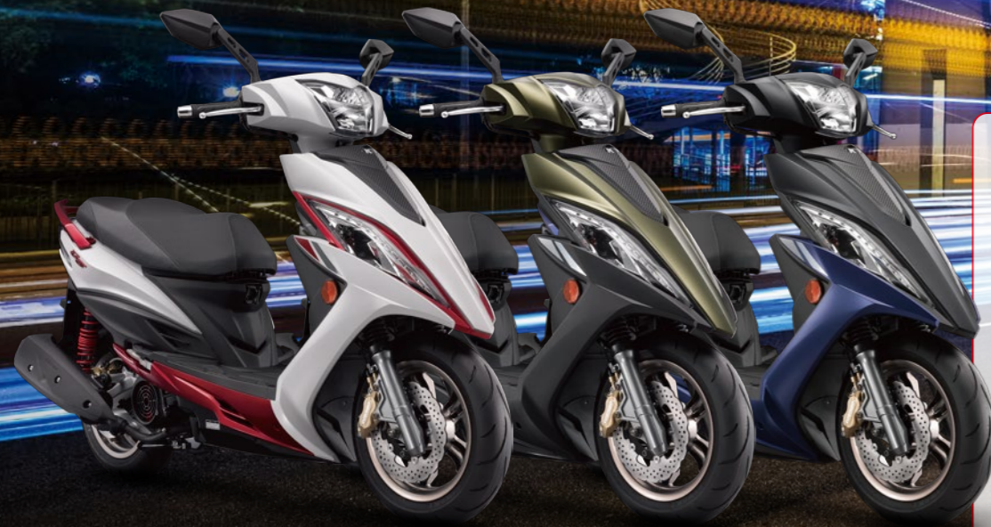
G6 150 BREMBO特仕版 平光白 NH265FA / 平光墨綠 WG531FA / 平光黑 WN105FA