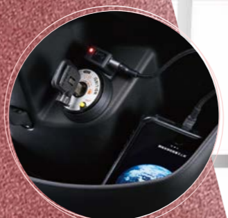
USB充電座 / 大型前開放式置物箱