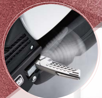
飛旋式踏板 美觀實用不沾你手