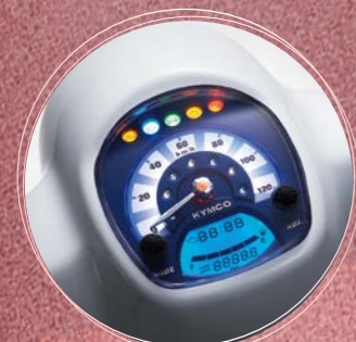
全新數位指針式儀表板 施華水鑽最閃耀

Touch美麗璀璨水晶魅力， Many110特飾版閃閃惹人愛，恒久復古的時尚Touch， 劃破時間、空間無限的閃耀流行風潮。