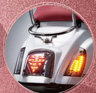
LED鑽石型後燈 精緻亮麗NO KISS