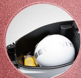
同級車超大後置物箱 裝下你滿滿的最愛