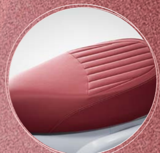
質感座墊 汽車等級更加魅力