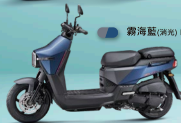
霧海藍 (消光) PB443F