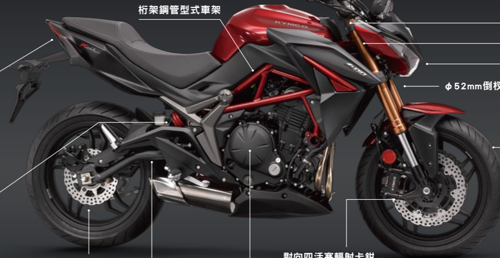
桁架鋼管型式車架