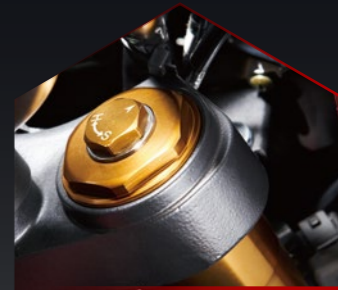
前避震器預壓可調整